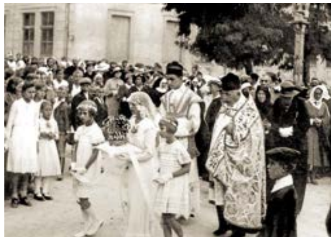
Bischof László bei seiner Primiz in Trausdorf.

Biškup ddr. Štefan László se je narodio 25. februara pred 110. Ljeti u Bratislavi, a odrastao - po ranoj smrti oca - u Trajštofu. Njegova majka, učiteljica Marica, skrbila se je za dobar odgoj. 1931. položio je ispit zrelosti i potom študirao teologiju u Beču. Na Martinju 1956. je kot prvi biškup iz Gradišća zaredjen u stolnoj crikvi u Željeznu. Značajan događaj u žitku i djelovanju biškupa ddr. Štefan Lászlóa je bilo njegovo sudjelovanje na Drugom vatikanskom koncilu (1962. - 1965.), kade je bio kotrig u komisija za apoštolat laikov i masovne medije.