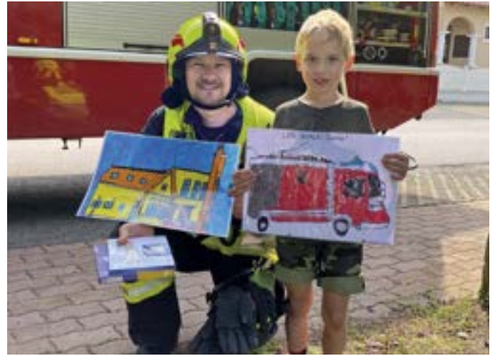
Die Kinder hatten sich schon vorab mit dem Thema „Feuerwehr“ auseinandergesetzt.

Den Kindern des Kindergartens und der Krippe wurde das Projekt „Feuerwehr“ im Vorhinein anhand verschiedener Bildungsangebote nähergebracht. Das Verhalten im Brandfall wurde erklärt und ausprobiert, damit nicht nur Erwachsene, sondern auch die Kinder im Ernstfall richtig reagieren können.