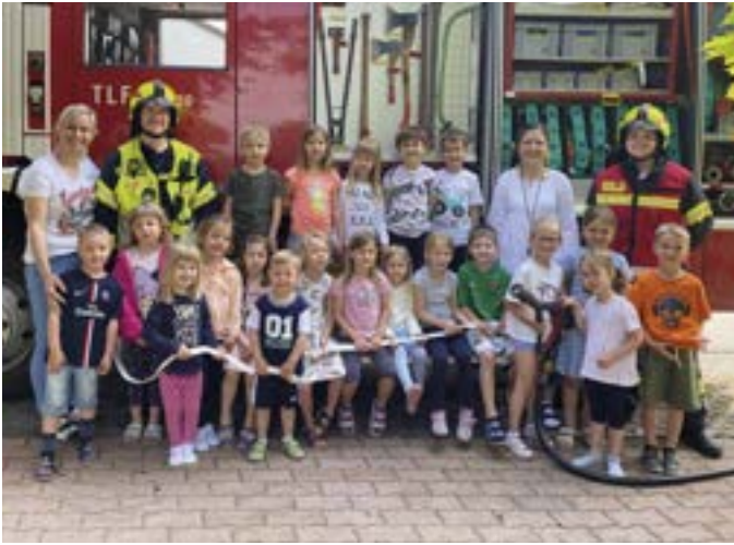
Die Brandschutzübung im Kindergarten und in der Kinderkrippe klappte hervorragend.

Ende Mai führten der Kindergarten und die Kinderkrippe Trausdorf in Kooperation mit der Freiwilligen Feuerwehr eine Brandschutzübung durch. 85 Kinder und 13 Erwachsene sind rechtzeitig aus dem Gebäude geflüchtet, bevor die Feuerwehrmänner mit dem Einsatzfahrzeug eintrafen.