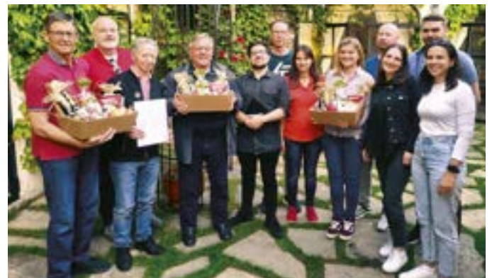
Feierlich wurden die verdienten Funktionäre verabschiedet und die neuen Teammitglieder willkommen geheißen.

Wir wünschen den neuen Funktionärinnen und Funktionären alles Gute bei ihrer Arbeit in der Ortsstelle und bedanken uns herzlich bei den bisherigen Mitarbeitern für ihre ehrenamtliche Arbeit - Aus Liebe zum Menschen.